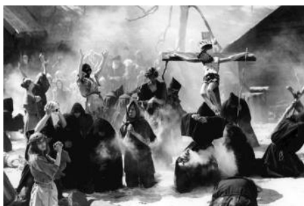
Fra Bergmans "Det Syvende Segl"

Andre håbede, at de ved at leve eksemplarisk kunne formidle Gud. I 1348 blev flagellanterne meget synlige. De havde eksisteret tidligere, men nu blev de meget demonstrative med store optog, hvor de piskede sig selv og de andre til blods, sang klagesange (f.eks. Dies Irae ) og holdt vilde prædikener, hvor de rasede mod de mange syndere,