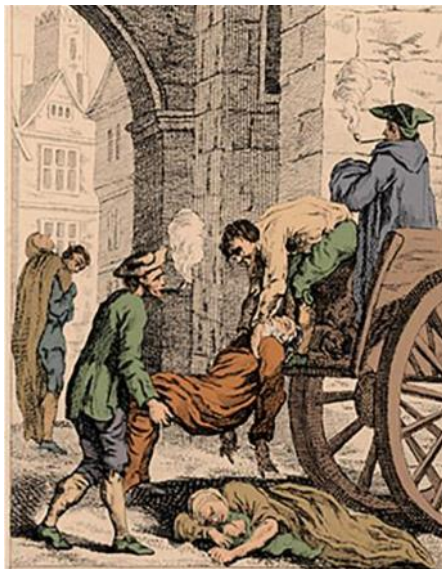
Den Sorte Død London i 1665

Byldepestens udvikling kan forklare den meget hurtige udbredelse: den bevægede sig 2-5 km om dagen. Men forklaringen er ret simpel: når folk hørte, at der var udbrudt pest i deres område, flygtede alle de, der havde mulighed for det. For størstedelen af befolkningen var flugt ikke en mulighed - bønderne var bundet til deres