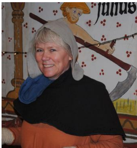
En glad formand

I lørdags havde vi julemarked. Og jeg bliver bare så glad, når jeg ser alle de glade mennesker, både gæster og alle os andre. Der kom lige omkring 400 gæster, og der var ca. 15 bodeholdere plus div. aktiviteter. Niller levede dejlig musik, og man kunne hugge runesten, bage snobrød og besøge trædrejeren, og der var smagsprøver på både øl og klejner. Det blæste og var hundekoldt, men hold da helt op, det kunne bestemt ikke ødelægge den gode stemning, der var på hele stormandsgården. Så tak til alle, der var med til at gøre vores julemarked til en fantastisk dejlig dag.