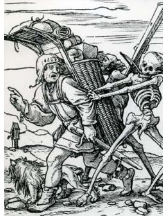
Hans Holbein d.y. Dance Macabre, 1523-26

Men pesten kom igen. I 1360 vendte den tilbage - voldsomt, men ikke med samme kraft. Der har været spekuleret i, om de overlevende fra 1350 kunne have udviklet en form for immunitet - vi ved det ikke. Der kan være en anden forklaring: De, der ikke blev dræbt under det første pestangreb, har formodentlig haft så meget modstandskraft, at mange undgik at blive smittet ved det andet angreb. De børn, der var født efter 1350, har haft almindelig mod-