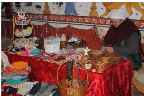
Masser af boder med masser af juleting