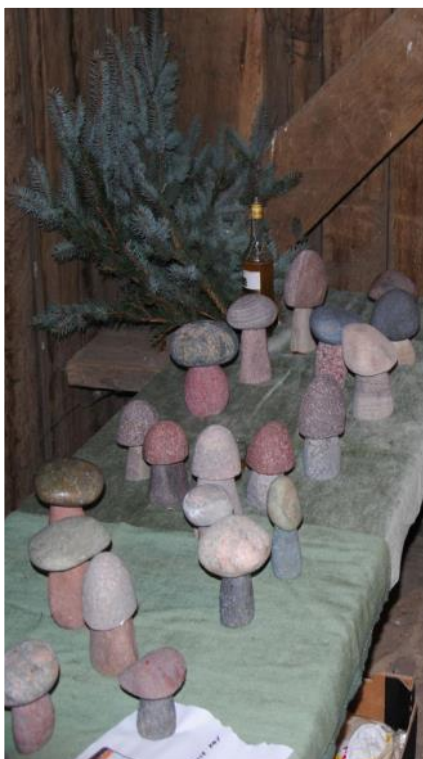
Svampe fra den forstenede skov