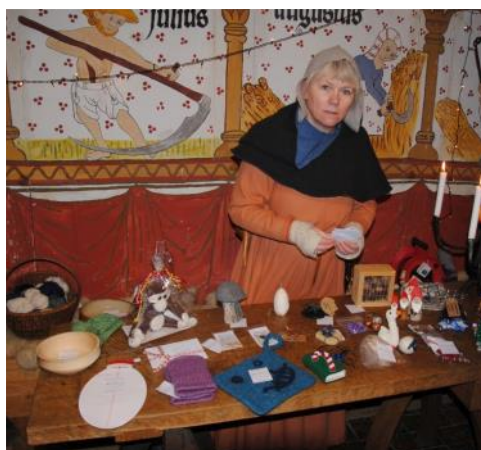
Fine præmier i lotteriet —men jeg vandt nu ikke noget!