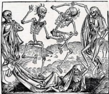
Michael Wolgemut Dance Macabre

fysisk kontakt med den syge eller med dennes tøj og sengetøj. Derefter brød sygdommen ud, og man døde efter \frac{1}{2} til 5 dage.