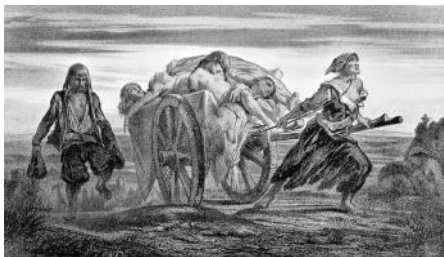
Pestofre litografi af Moyne baseret på arbejde i Duveau's samlinger.

stadig historikere, der tror på denne teori, men argumenterne for, at der er tale om to vidt forskellige sygdomme, er overvældende: