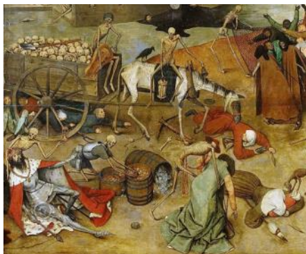
Pieter Brueghel den ældre Dødens triumf (udsnit)

Dette var ikke acceptabelt for kirken, og der blev derfor sendt forespørgsler til de førende naturvidenskabsfolk på universitetet i Paris. (Den franske konge spurgte samtidig de lærde i Paris og Montpellier - men svaret blev det samme.) De lærde - der i nutidens terminologi var astrologer - kunne svare: Den 20. oktober 1345 kl. 13 stod Mars, Saturn og Jupiter alle i Vandmandens tegn, og det skabte ubalance mellem planeterne, hvorved der opstod jordskælv og andre ulykker på jorden, hvorved der blev frigivet en stor