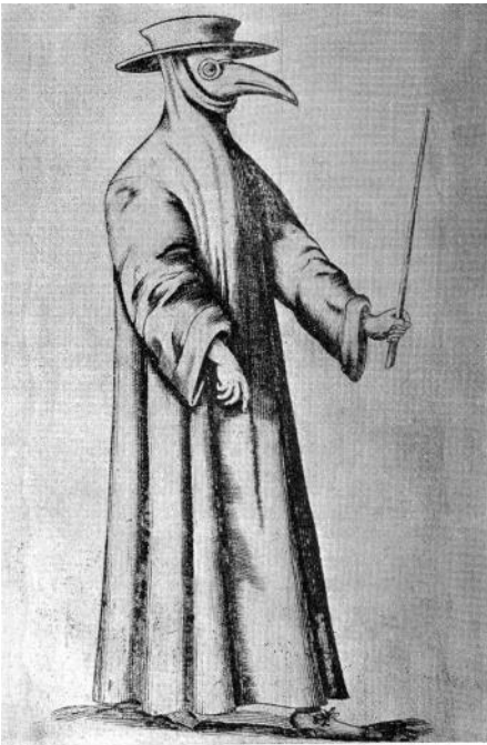
Pestlæge i sin beskyttelsesdragt med rødt glas i 'brillerne' og et næb med eddike og forebyggende urter

Kirken prøvede også at forebygge sygdomme, men her var kuren at bede. Opfattelsen var, at hvis man var i åndelig ubalance, påvirkede det kroppen og man blev syg. Hyppige bønner ville holde en i balance, og kroppen ville derfor ikke blive syg. Måske virkede det!