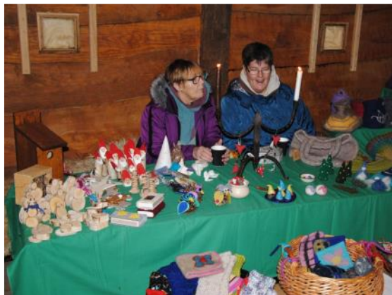
Varer kan man få i tusindvis Tænk dem bare under indkøbspris