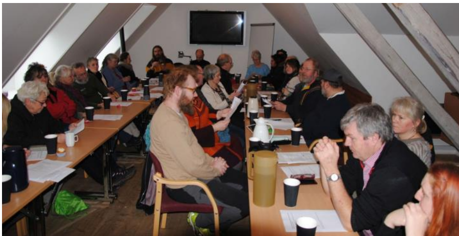
Fra en velbesøgt generalforsamling i 2014

Jeg ønsker en god midvinter, og en glædelig jul til alle!