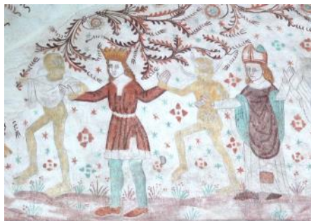
Elmelundemesteren, Nr. Alslev Kirke Danse Macabre - konge og biskop

der ikke fulgte dem. I starten fik de støtte af paven, men efterhånden blev de så fanatiske, at paven fik nok og bevægelsen blev forbudt.